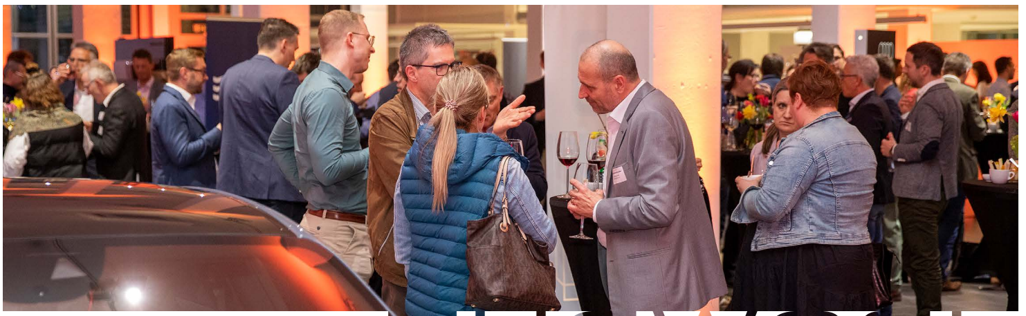
NETWORKING AM FRÜHJAHRANLASS