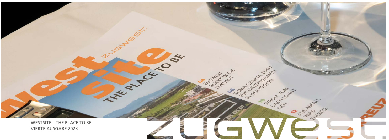
WESTSITE – THE PLACE TO BE VIERTE AUSGABE 2023