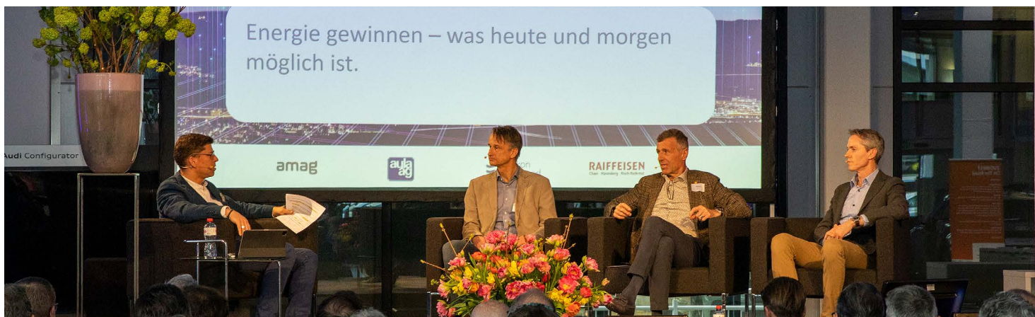
ANGEREGETE PODIUMSDISKUSSION AM FRÜHJAHRANLASS