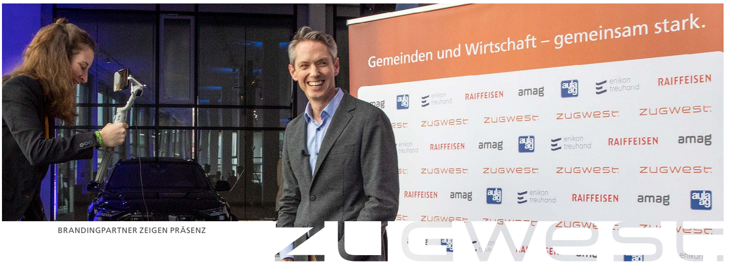
BRANDINGPARTNER ZEIGEN PRÄSENZ