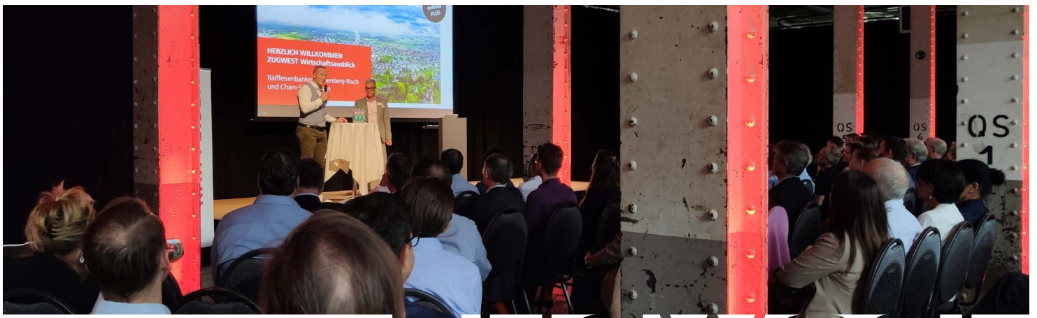
WIRTSCHAFTSAUSBLICK IM KALANDERSAAL