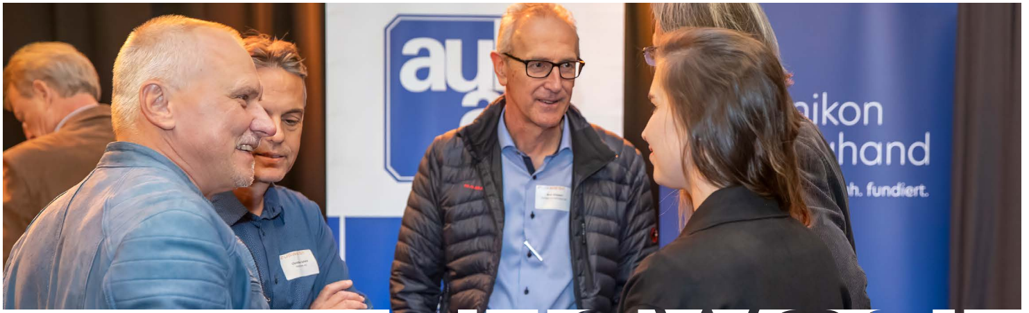
AM WIRTSCHAFTSAUSBLICK MIT DER RAIFFEISENBANK