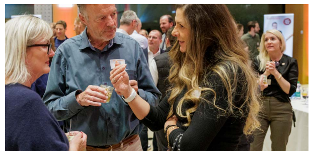
NETZWERKEN UND PERSÖNLICHE BEGEGNUNGEN AN ZUGWEST ANLÄSSEN