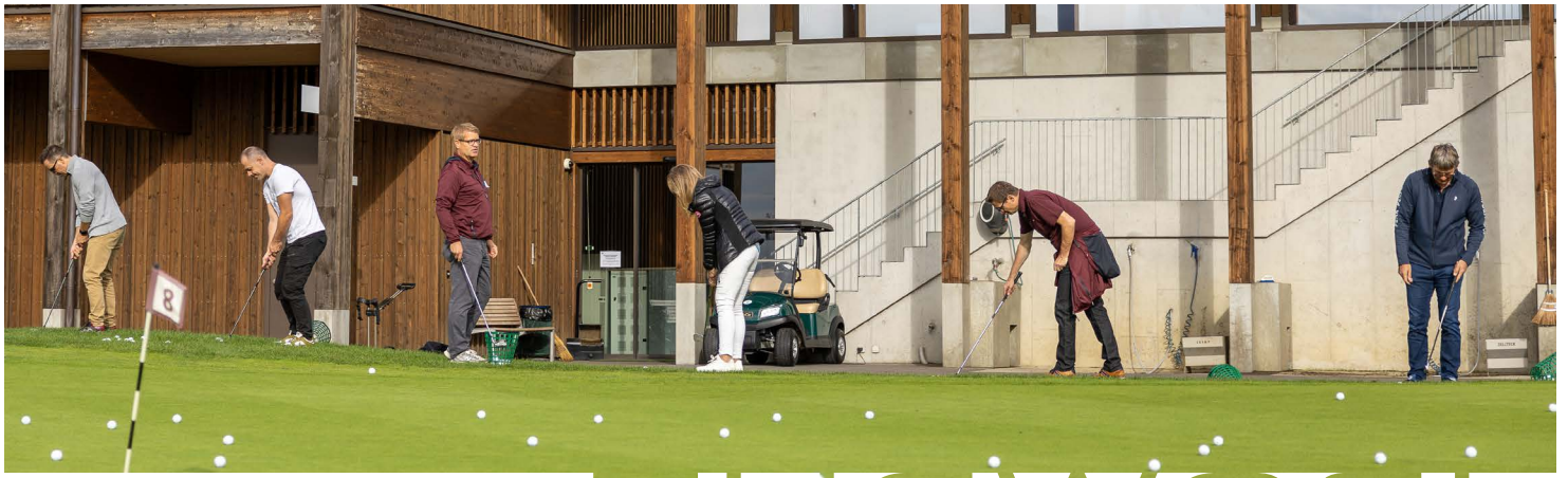
ÜBUNG MACHT DEN MEISTER – CO-EVENT GOLF