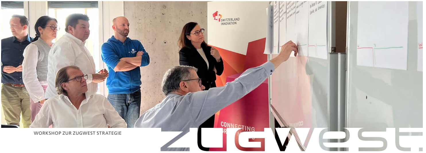
WORKSHOP ZUR ZUGWEST STRATEGIE