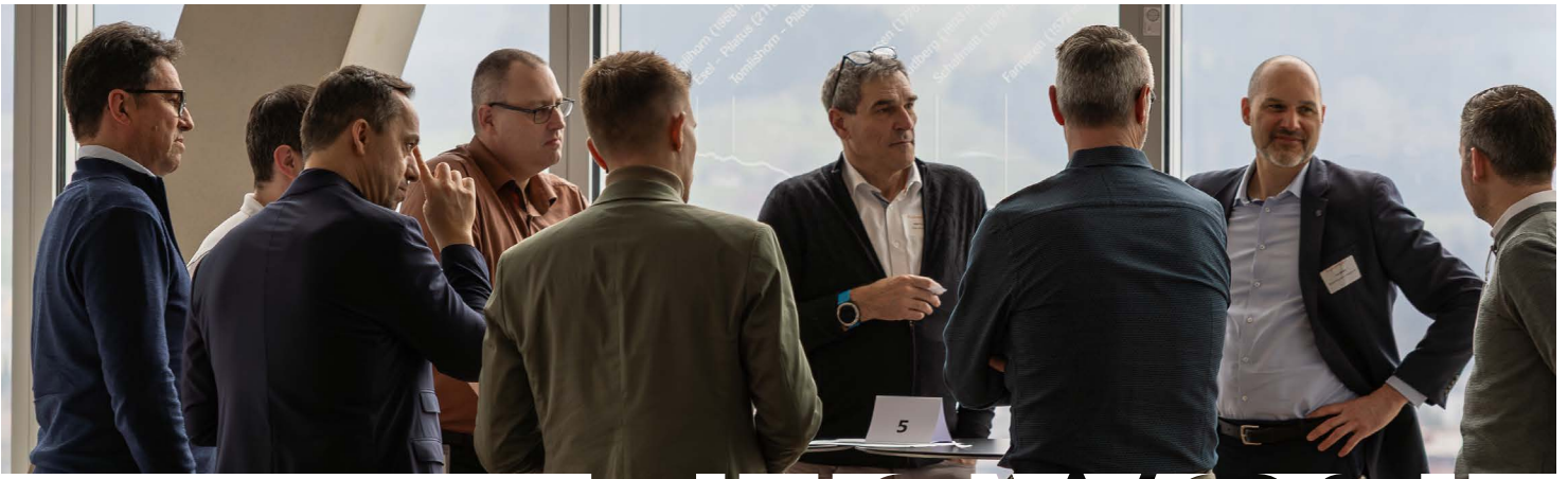
ANGEREGETE DISKUSSION IM WORKSHOP, CO-EVENT BEI ROCHE DIAGNOSTICS