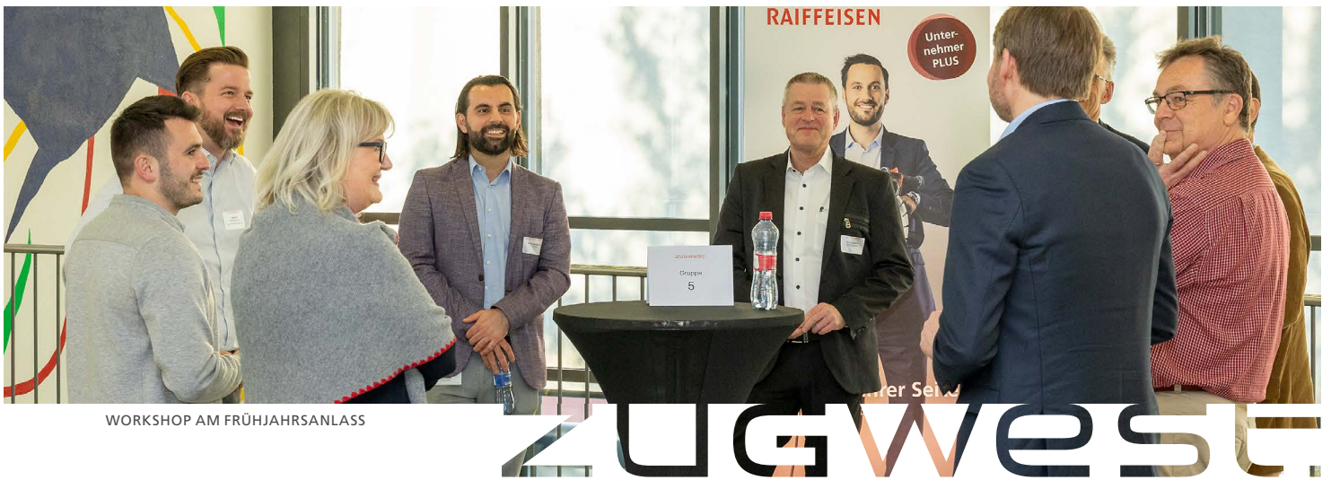
WORKSHOP AM FRÜHJAHRSANLASS