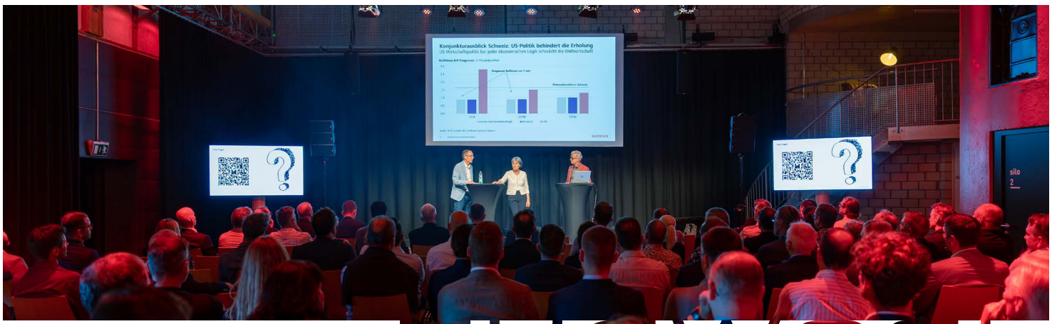
WIRTSCHAFTSAUSBLICK IM BÖSCHHOF